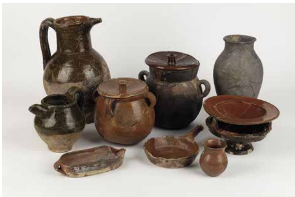
Objectes de terrissa del segle XVII procedents de la plaça Gran Intervenció arqueològica, 1982 Museu de Mataró