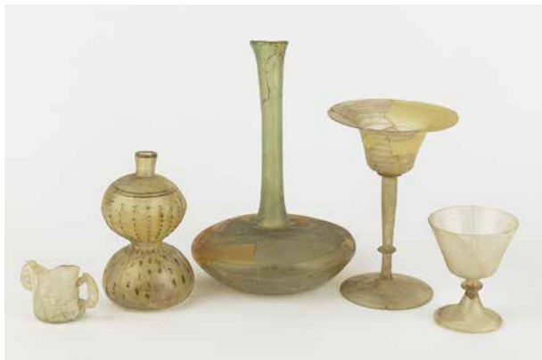
Objectes de vidre del segle XVII procedents de la plaça Gran Intervenció arqueològica, 1982 Museu de Mataró

Les excavacions dutes a terme en aquest indret han permès recuperar un llegat molt important de vaixel·la i altres objectes domèstics del segle XVII, localitzar el magnífic mosaic que forma part de la domus dels Dofins, i també les estructures per poder refer i dimensionar la domus de Can Cruzate, a més de la recollida d'un important nombre d'objectes. Els estudis de recerca i treballs documentals posteriors han facilitat que aquestes dues domus romanes es puguin recrear en 3D per fer-ne una visita immersiva. És la primera vegada que es duu a terme una proposta d'aquestes característiques per donar a conèixer les domus de la ciutat d'Iluro.