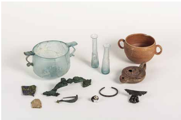
Objectes d'època romana procedents d'Iluro Intervencions arqueològiques 1980 - 2014 Museu de Mataró