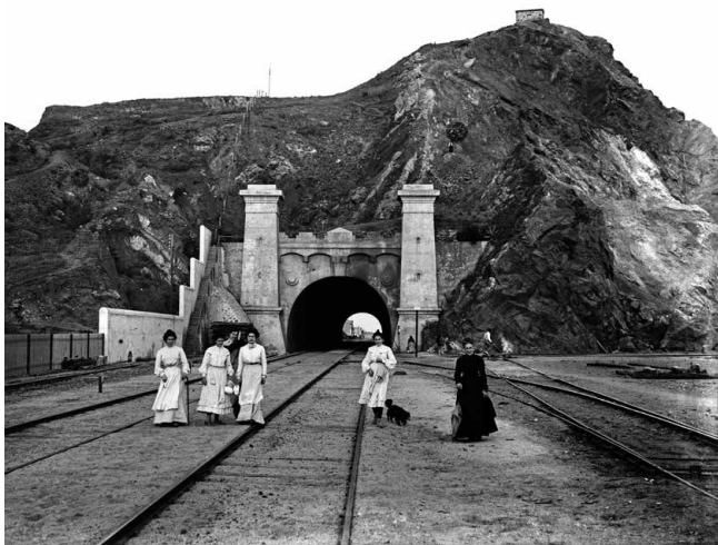
Túnel de Montgat, 1905 Arxiu Comarcal del Maresme Fons 70-385. Col·lecció de documents ferroviaris de Xavier Nubiola de Castellarnau