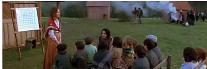
L'escola de la colònia Cecilia .

Dins la seva filmografia destaquen títols com L'Ombre rouge , Balles perdudes , Buenaventura Durruti: anarquista , Ante los fantasmas o Nicolas Philibert, hasard et nécessité .