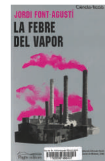
La Febre del vapor