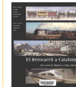
El Ferrocarril a Catalunya: del carril de Mataró al tren d'alta velocitat

TUELLS MORENO, Lluís Miquel. Trens de postal: el ferrocarril a Catalunya. El Papiol: Efadós, 2015.