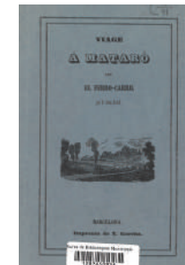
Viaje a Mataró con el ferrocarril