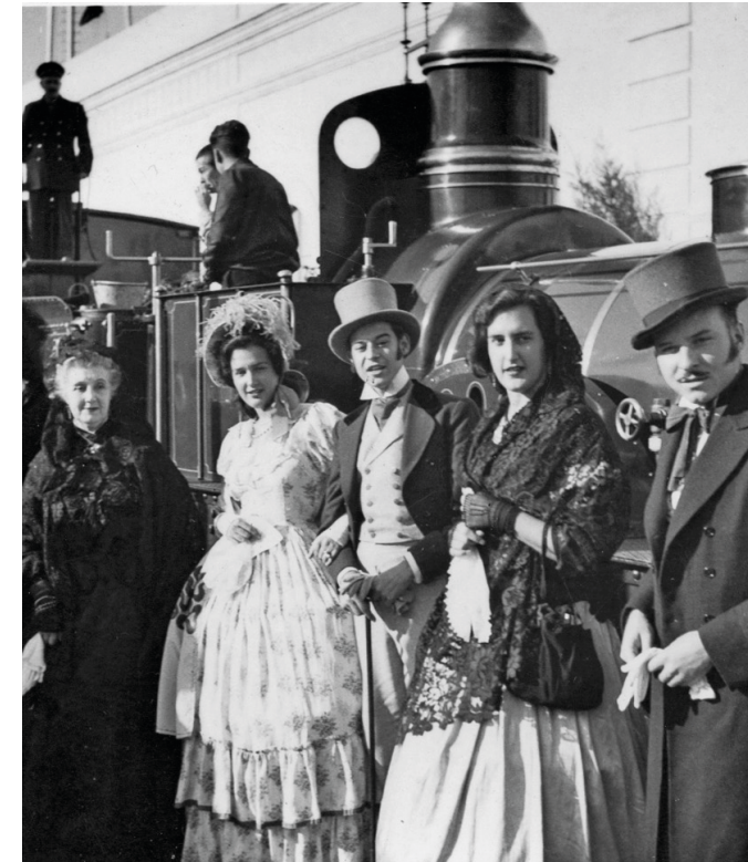
Tren del Centenari a l'estació de Barcelona, 28 d'octubre de 1948. ftxn 1486.

Mataró sempre ha estat fidel a promoure la celebració dels aniversaris de la inauguració del primer ferrocarril, el 28 d'octubre de 1848, i de la mort del seu principal impulsor i fill de la ciutat, Miquel Biada i Bunyol, el 2 d'abril de 1848.