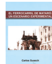
El Ferrocarril de Mataró: un escenario experimental