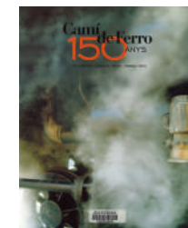
Camí de ferro: 150 anys