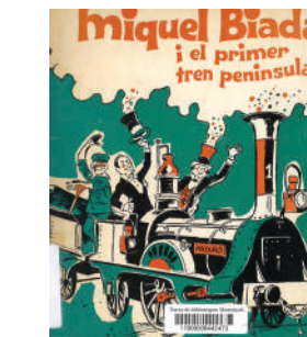
Miquel Biada i el primer tren peninsular