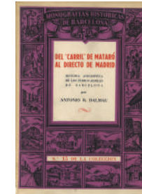
Del Carril de Mataró al directo de Madrid