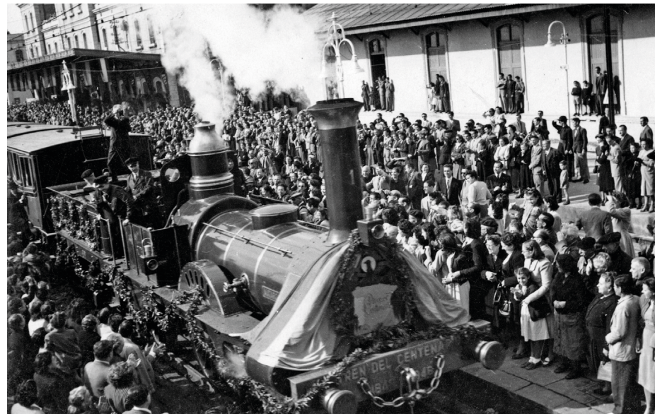
Arribada del Tren del Centenari a Mataró, 28 d'octubre de 1948.