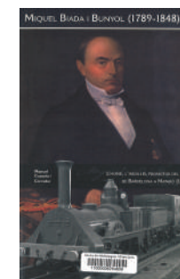
Miquel Biada i Bunyot: 1789-1848