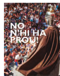
No n'hi ha prou!