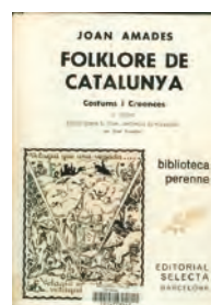
Folklore de Catalunya