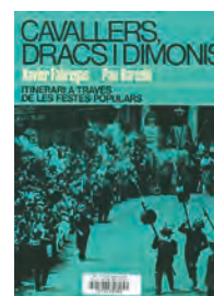
Cavallers, dracs i dimonis: itinerari a través de les festes populars