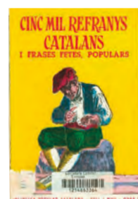
Cinc mil refranys catalans i frases fetes populars