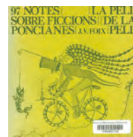
97 notes sobre ficcions poncianes