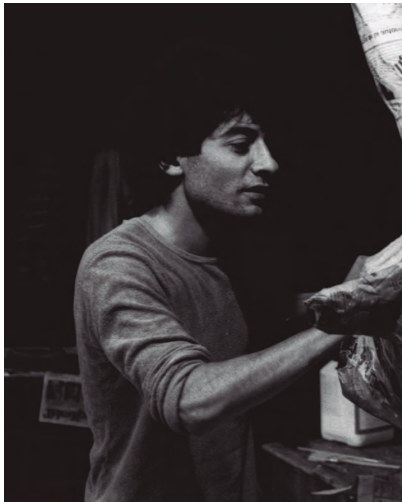
Construcció del cap de la Momerota. 1979 Autor: Joan Llavina

La presentació de la Momerota remet a les rondalles. El regne de la imaginació i la utopia s'instal·la de cop i volta a l'univers de la festa. "Tems era tems, aquell de quan les bèsties parlaven i els ocells tenien dents..." Les paraules en viu no obliden la iniciativa popular que hi ha al darrere, ni la ferma voluntat de donar a la ciutat aquella figura amb cap de bou que té un nom estrofolari.