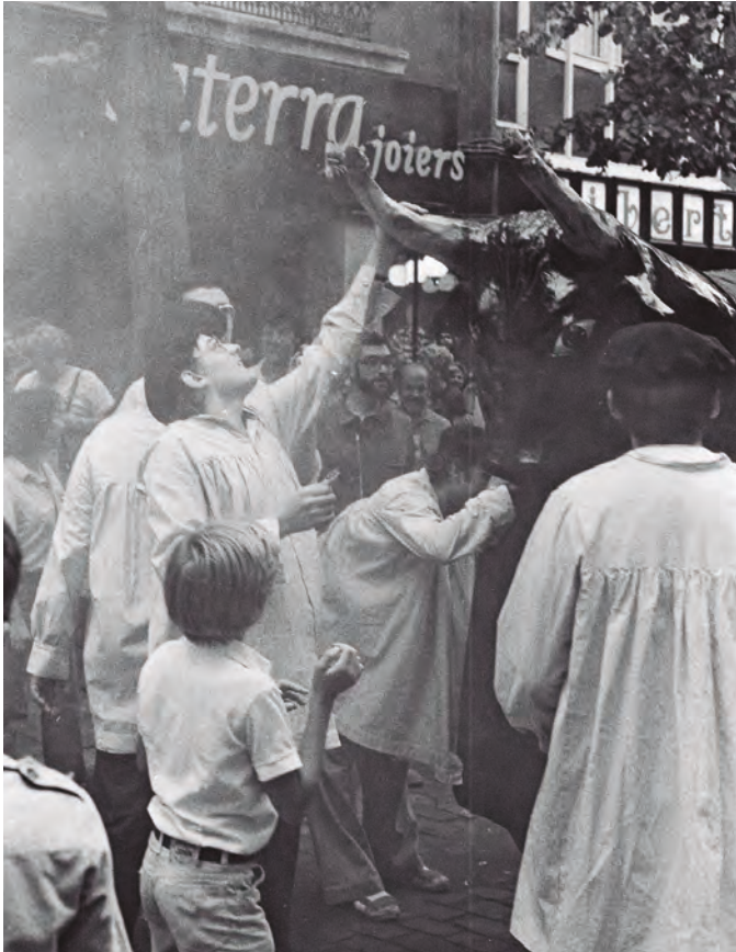
Encesa de la Momerota. 1979 Autor: Miquel Sala