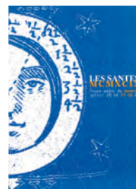
Les Santes MCMXCIX